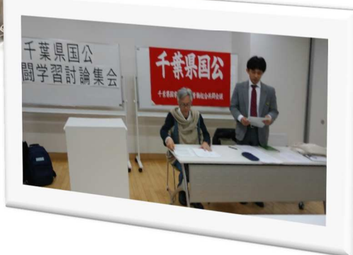
⇒ 成田地区での討論集会（1/17）