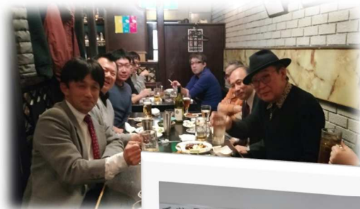
← 店を借り切つて旗開きの千葉（1/17）